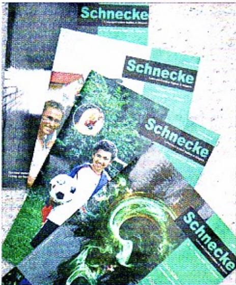
Die bundesweit erscheinende Fachzeitschrift für Hörgeschädigte wird in Illertissen produziert und erscheint viermal im Jahr.

Mit sehr viel Fingerspitzengefühl schafft es die Redakteurin, den Grundgedanken „Überwindung der Taubheit“ so vielseitig wie möglich zu beleuchten. Die rasante Entwicklung der Technik erfordert in der „Schnecke“ Informationen über Neuerungen im Therapiebereich, in der Hörgeschädigten-Pädagogik, oder in der Frühförderung hörgeschädigter Kinder, wobei für deren Eltern zum Beispiel Berichte über junge Erwachsene entscheidende Hinweise enthalten können.